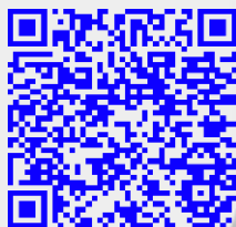
Tabela de Preços VERSÃO 3

Grade de programação válida a partir de 09 de Janeiro'26