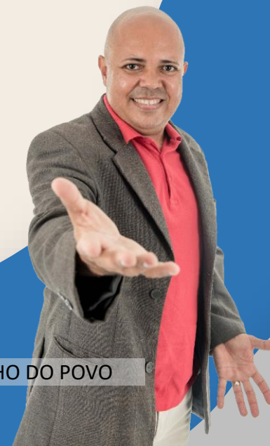
ALANZINHO DO POVO

Fonte: Kantar IBOPE Media – Instar Analytics – Natal/RN – 16 a 22/03/24 Projetada no Atlas de Cobertura 2024 da RECORD.