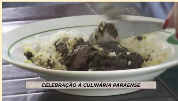
CELEBRAÇÃO À CULINÁRIA PARAENSE