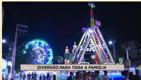
DIVERSÃO PARA TODA A FAMÍLIA

OPORTUNIDADE PARA ATIVADAÇÃO DA MARCA DO PATROCINADOR.