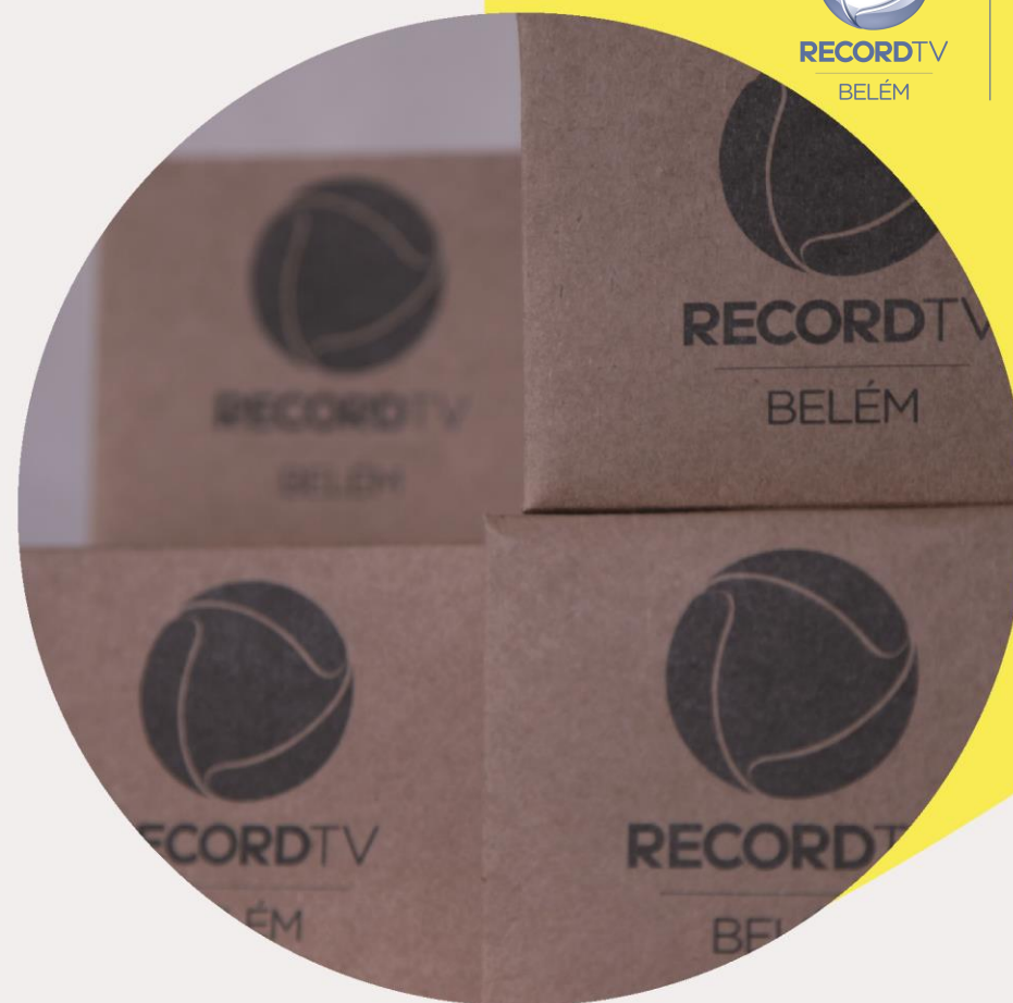
Tabela de Preços: Outubro 2019

OPORTUNIDADE PARA ATIVÇÃO DA MARCA DO PATROCINADOR.