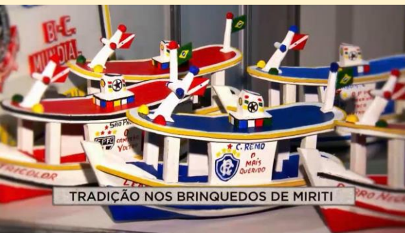
TRADIÇÃO NOS BRINQUEDOS DE MIRITI