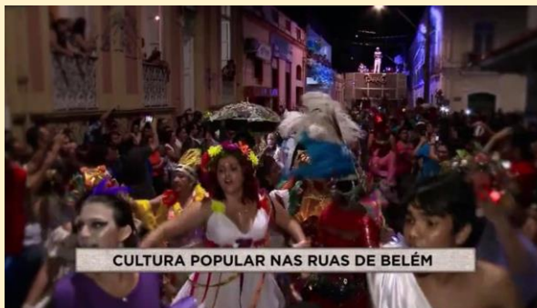
CULTURA POPULAR NAS RUAS DE BELÉM

Os vídeos comerciais especiais que são produzidos pela “Record TV Belém”, entram no tema do Círio e deixam o break de intervalo no clima do evento. A abordagem audiovisual foca na culinária, nas curiosidades, na cultura e nas peculiaridades do evento mais.