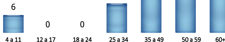
Faixa Etária (%)