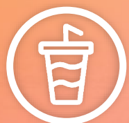
BEBIDAS NÃO ACÓOLICAS