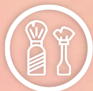
HIGIENE PESSOAL E BELEZA