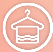
CAMA, MESA E BANHO