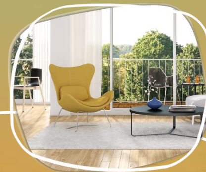
CASA DOS PERSONAGENS (Quarto, Sala de Estar/Jantar, Cozinha, Banheiro, Escritório)

Nesse contexto, e pelos diferentes perfis dos personagens, é possível introduzir os seguintes segmentos: