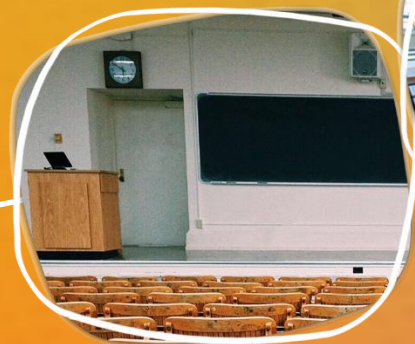
UNIVERSIDADE (Sala de Aula)