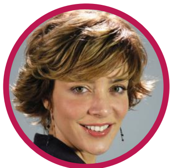
AURÉLIA CAMARGO Christine Fernandes