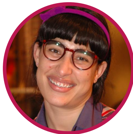
ANABELA PALHARES Giselle Itié