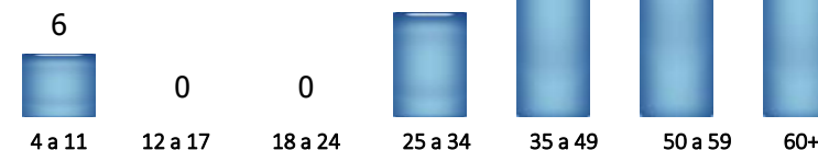
Faixa Etária (%)