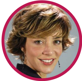
AURÉLIA CAMARGO Christine Fernandes