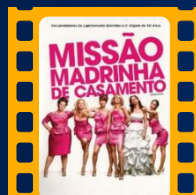
Missão Madrinha de Casamento