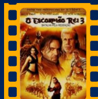
O Escorpião Rei 3