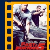
Velozes e Furiosos 5