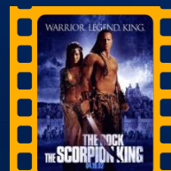
O Escorpião Rei