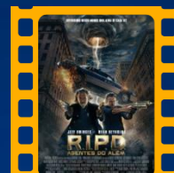
R.I.P.D. Agentes do Além