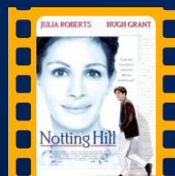
Um Lugar Chamado Nothing Hill