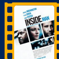
O Plano Perfeito