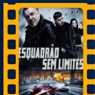
Esquadrão Sem Limites