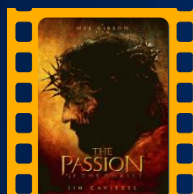
A Paixão de Cristo