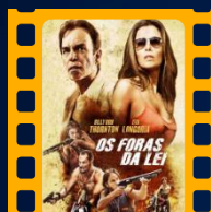
Os Foras da Lei