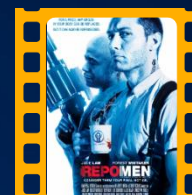
O Resgate de Órgãos