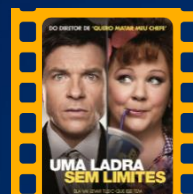
Uma Ladra Sem Limites