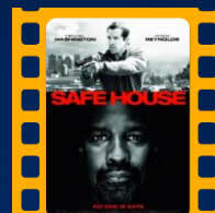
Protegendo o Inimigo