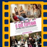
O que esperar quando você está esperando