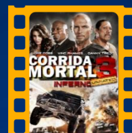
Corrida Mortal 3