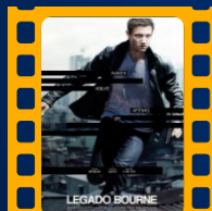
O Legado Bourne