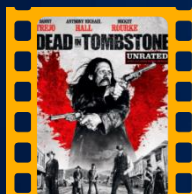
Inferno no Faroste