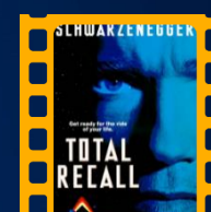
O Vingador do Futuro