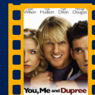
Dois é Bom, Três é Demais