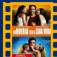
Eu Queria Ter a Sua Vida