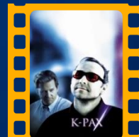
K-Pax: O Caminho da Lux