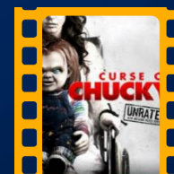
A Maldição de Chucky