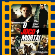
O Jogo Mortal