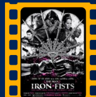
O Homem com Punhos de Ferro