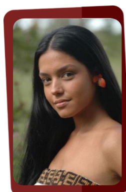
TINI-Á Thaís Fersoza