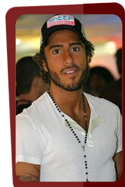
PRIMO EMÍLIO Marcos Mion