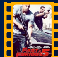
Velozes e Furiosos 5