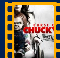
A Maldição de Chucky