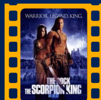
O Escorpião Rei