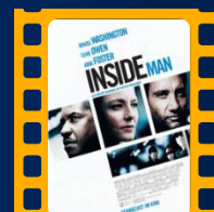
O Plano Perfeito