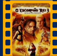
O Escorpião Rei 3