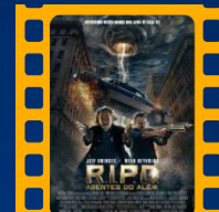
R.I.P.D. Agentes do Além