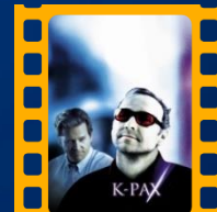
K-Pax: O Caminho da Lux