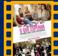
O que esperar quando você está esperando