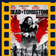
Inferno no Faroeste