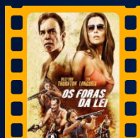
Os Foras da Lei