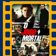
O Jogo Mortal