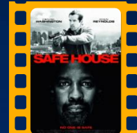
Protegendo o Inimigo