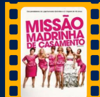
Missão Madrinha de Casamento