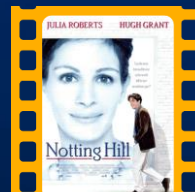
Um Lugar Chamado Nothing Hill