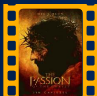
A Paixão de Cristo