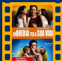
Eu Queria Ter a Sua Vida