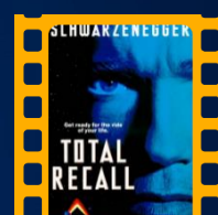
O Vingador do Futuro