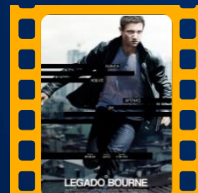
O Legado Bourne