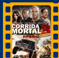
Corrida Mortal 3