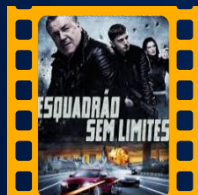
Esquadrão Sem Limites