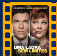
Uma Ladra Sem Limites