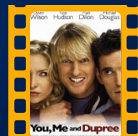
Dois é Bom, Três é Demais