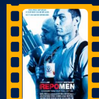
O Resgate de Órgãos